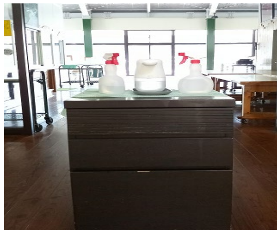
食堂入口にアルコール設置