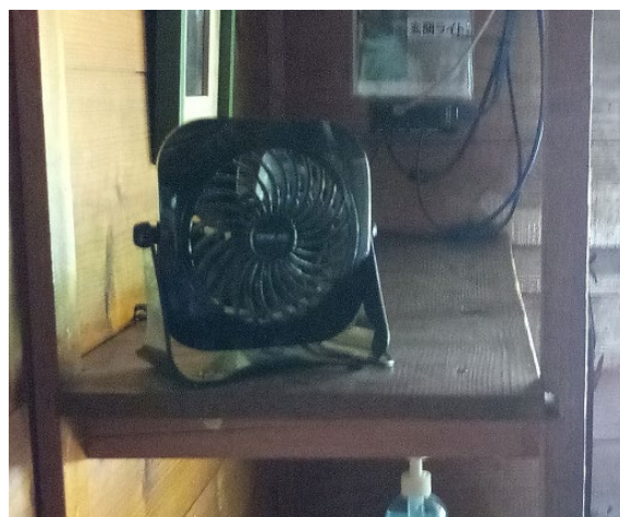
バンガロー入口に換気設備有り