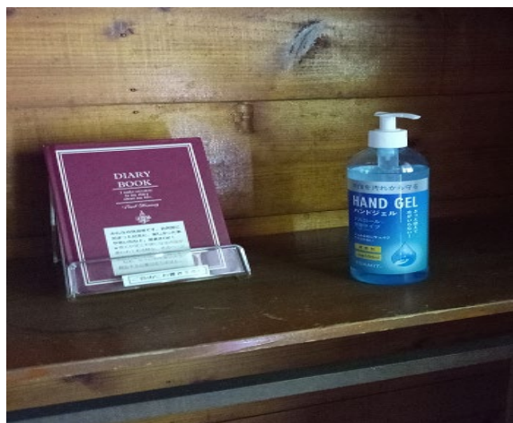
バンガロー室内と各教室に1つアルコール設置