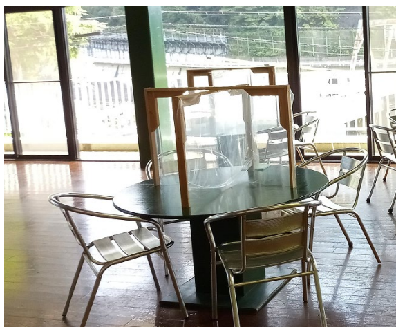
各テーブルに飛沫防止パネル設置