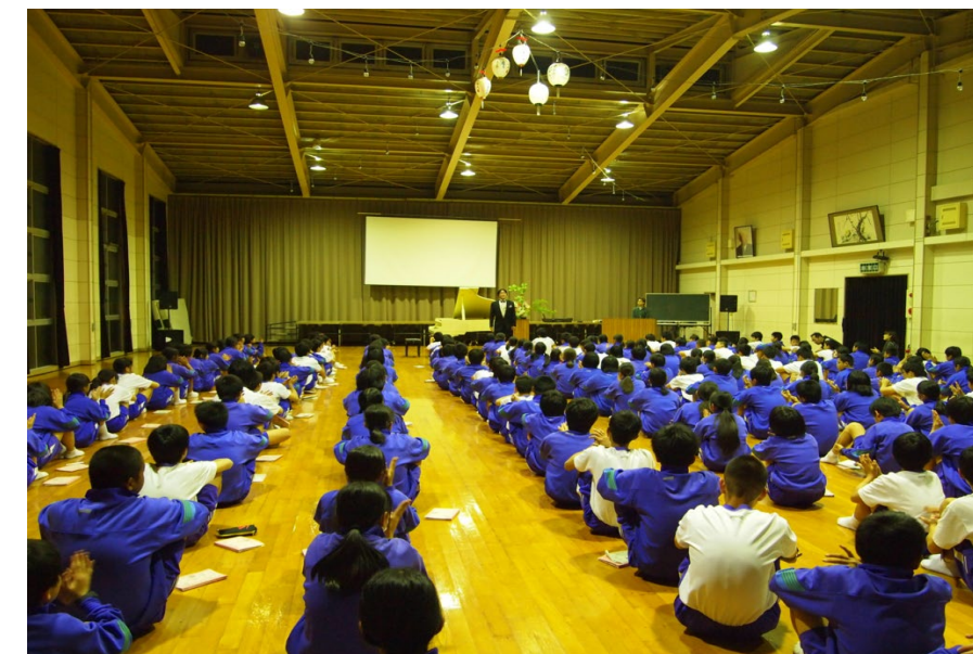
信定ホール（約 200 人の様子）