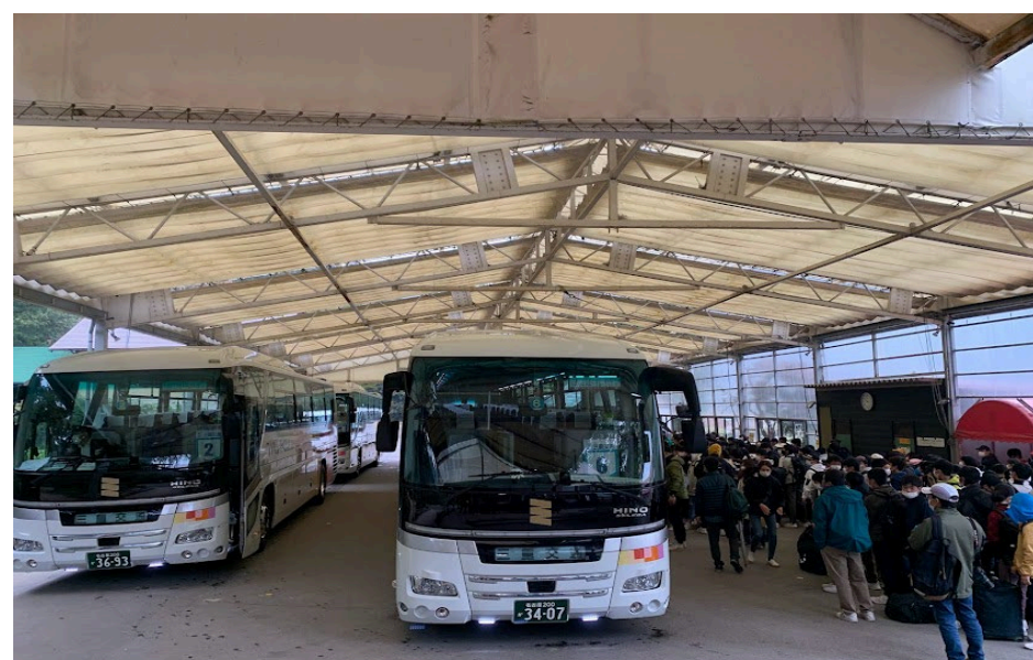
テント下バス 4 台停車の様子

テント下は最大バス 4 台まで。降車後にテント下をご利用の場合、バス転回所（屋根はありません）で降りていただき、歩いてテント下にお入りいただきます。