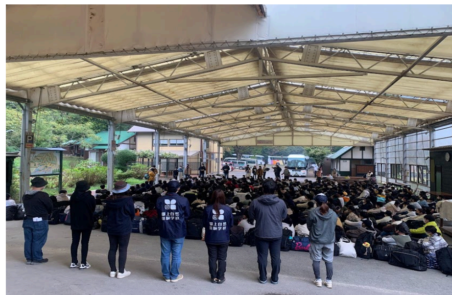
テント下での式（約 250 人の様子）式中はバスは通れません